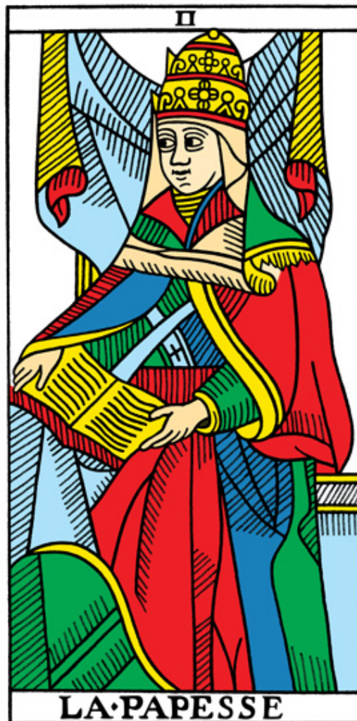
马赛塔罗: 女教皇牌

因此, 马赛塔罗中的女教皇 — 一个具有教皇属性的女性形象, 手中的书则有着教会的权利, 无上的智慧的结晶.